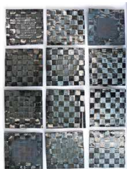
Abb. 2: Zwölf CF-Lagen, durch induktive Erwärmung aus einer 60 x 60 mm CFK-Platte separiert

E-Mail: klaus.drechsler@ict.fraunhofer.de